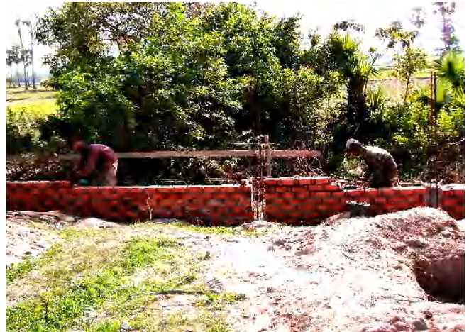
4月21日には外壁のレンガ積みが始まりました。