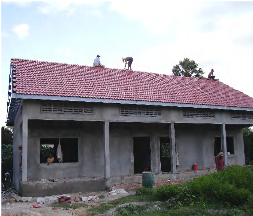
7월 16일의 모습