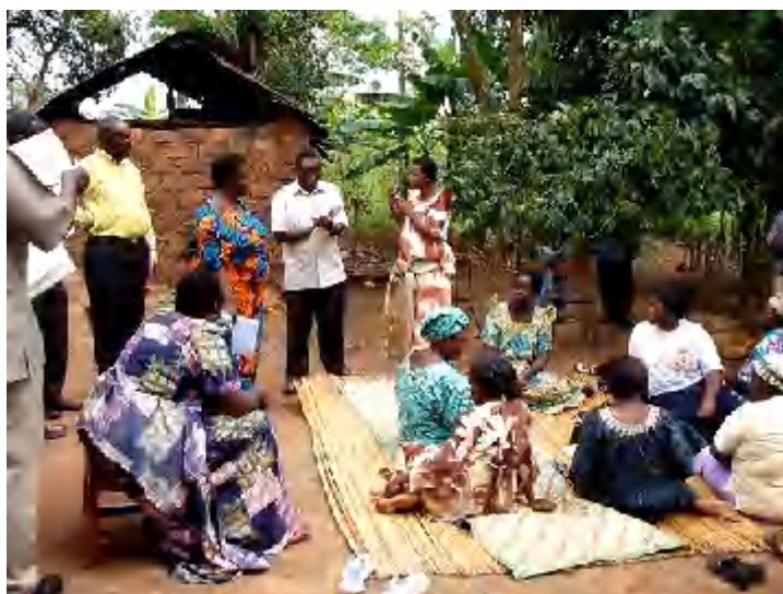
活動風景（村のおばちゃんに聞き取り）

具体例を挙げましょう。研究部門は、栄養価の高いサツマイモの品種改良、エイズの抗レトロウイルス薬開発、スラムにおけるゴミ問題対策研究、中等教育における女子の就学率向上に向けた取り組み等々、多岐に渡っています。一方、研修部門では、需要の高い灌漑水資源管理や食品加工・市場調査等の研修