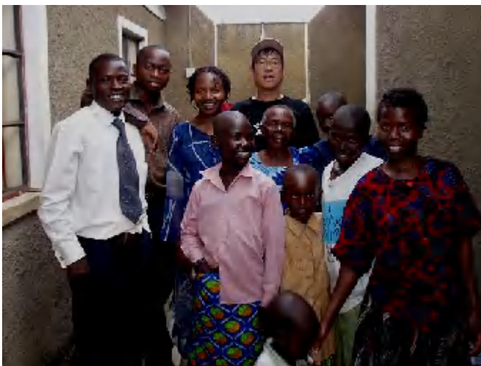
東部の町ムバレにて

とはいうものの、コミュニティと共に活動するというのは、特に大学関係者にとって、苦手なようです。モニタリングのために研究者と一緒にコミュニティを訪問した時、当該研究者がコミュニティに行ったことがない、あるいはコミュニティの場所すら知らないということが何度かありました。テーマだけを聞くと、実に面白そうな研究内容なのですが、如何せんコミュニティとの結びつきが希薄なのです。そんなものは、研究のための研究でしかありません。少なくとも、貧困削減に資する研究として助成する意味はなかろうかと思えます。