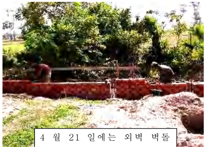
4 월 21 일에는 외벽 벽돌 쌓기 시작