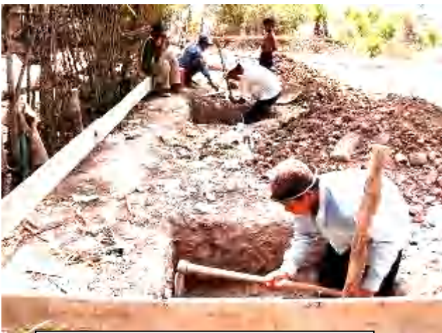
공사 개시 직후의 기초공사

이와 같은 방식은 전부 다 리티씨가 생각낸 것으로 리티씨의 능력에 다시 한 번 감탄했습니다.