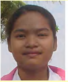
So Sophos/Somphos 15歳 5年生